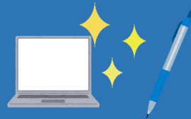
⑧使用文具・機器等の 除菌