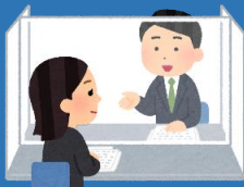
⑦飛沫防止の アクリル板設置