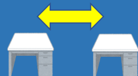
⑨間隔を空けた 座席配置