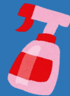
⑥デスク・共用部分・ 応接スペースの除菌